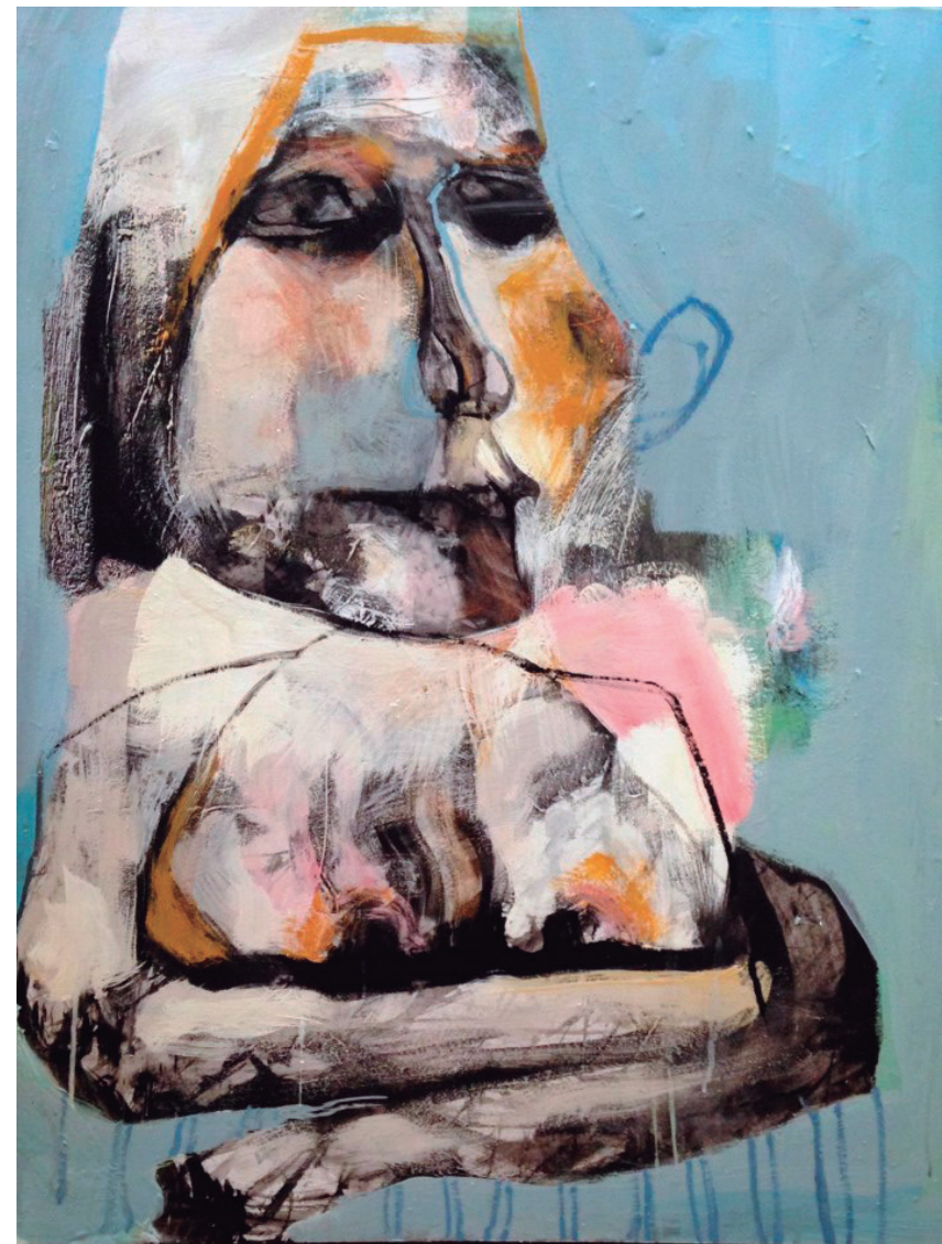
Retrato de mujer 2017 Acrílico sobre tabla 60 x 80 cm