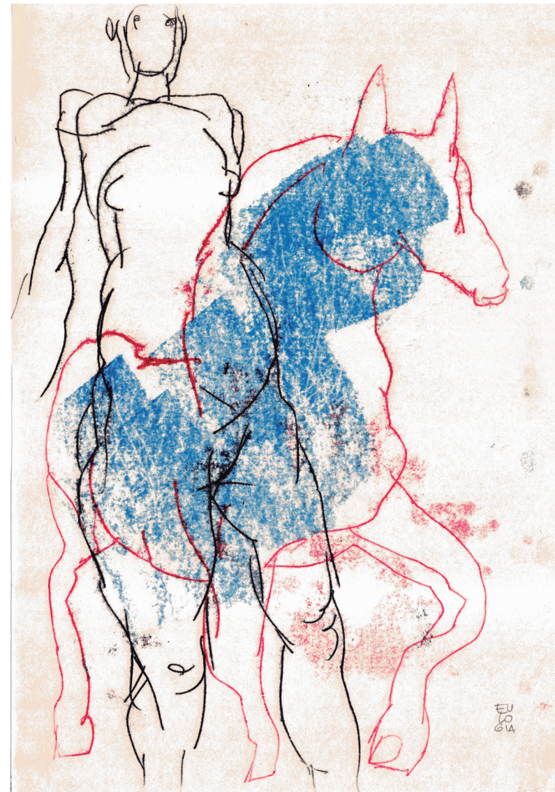
Tonal II 2021 Monocopia 35 x 50 cm