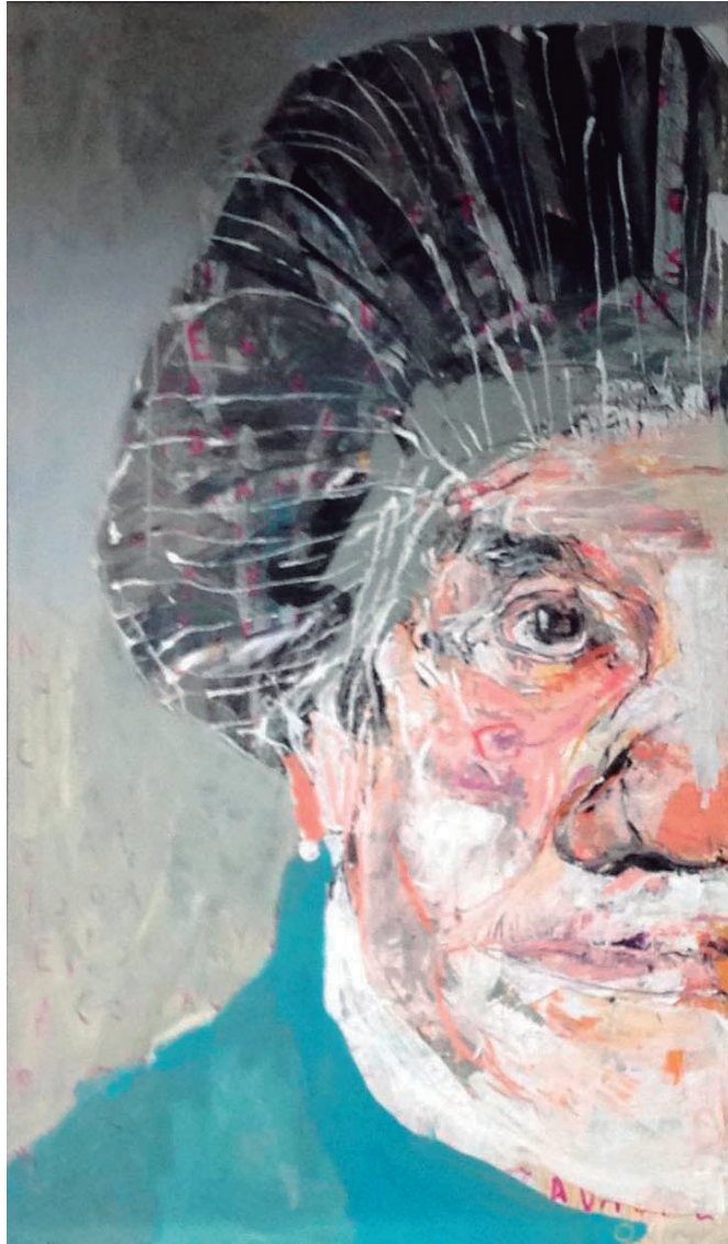
Abuela (díptico) 2019 acrílico sobre madera 185 x 154,5 cm