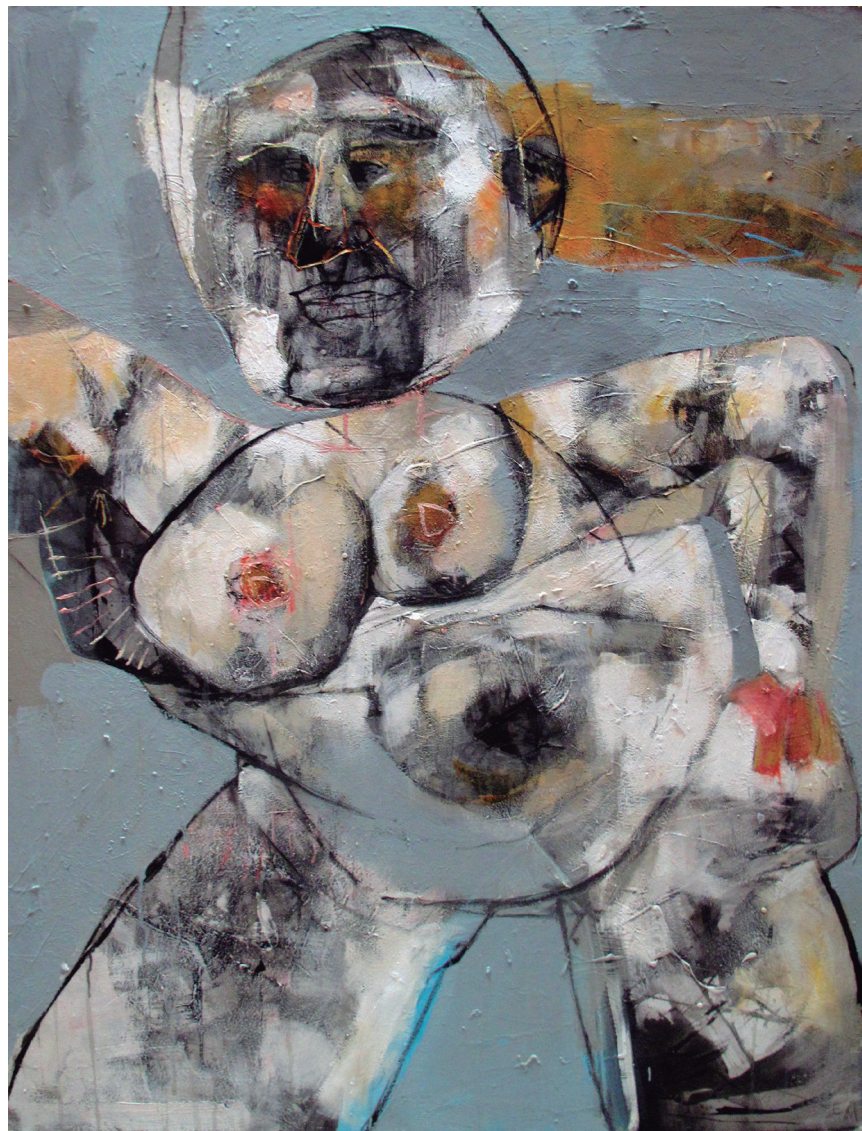
Mujeres VIII 2018 Acrílico sobre tabla 94 x 122,5 cm