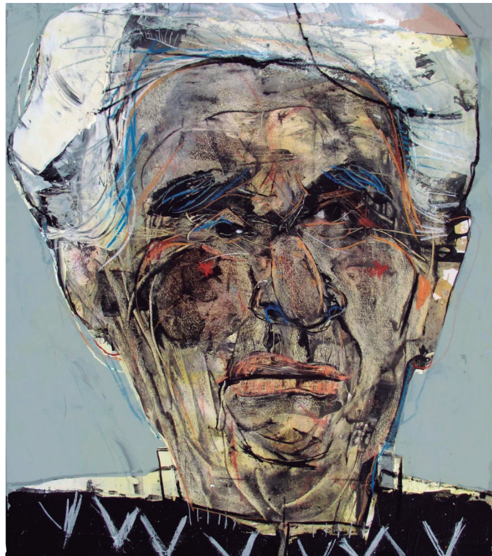
Chavela 2019 acrílico sobre madera 50 x 61 cm