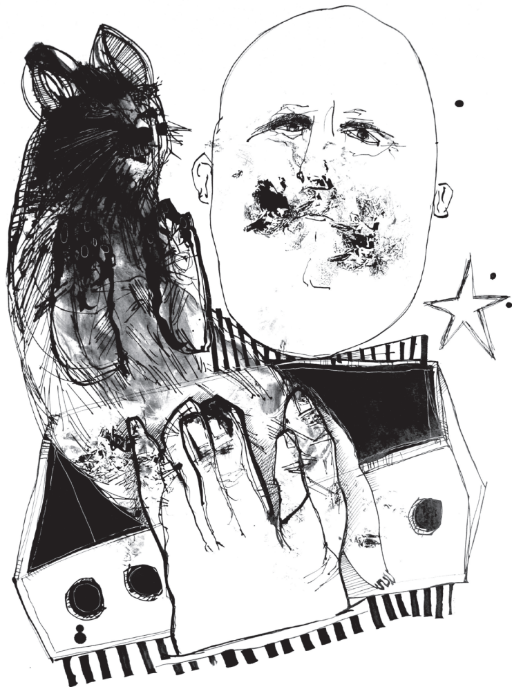
El gato de la caja 2019 Tinta china sobre papel 70 x 100 cm