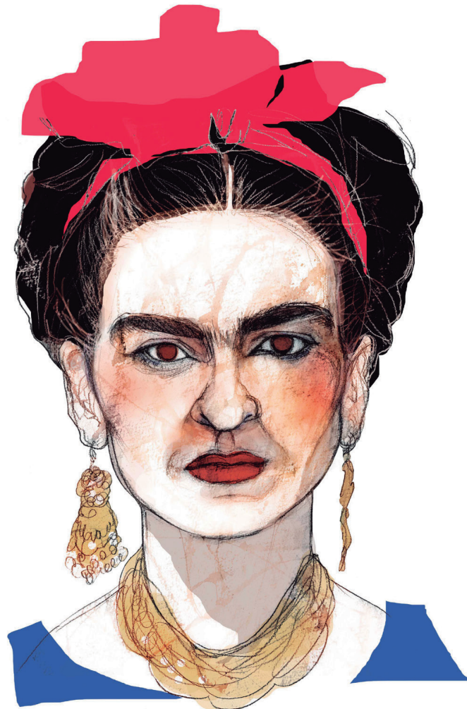
Frida Kahlo 2020 Tinta y pastel sobre papel 35 x 50 cm