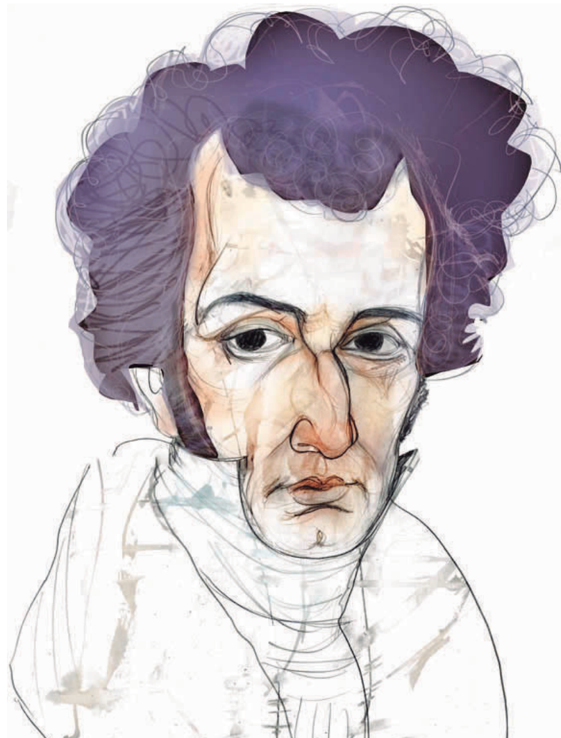
José Patiño 2011 Tinta y pastel sobre papel 35 x 50 cm