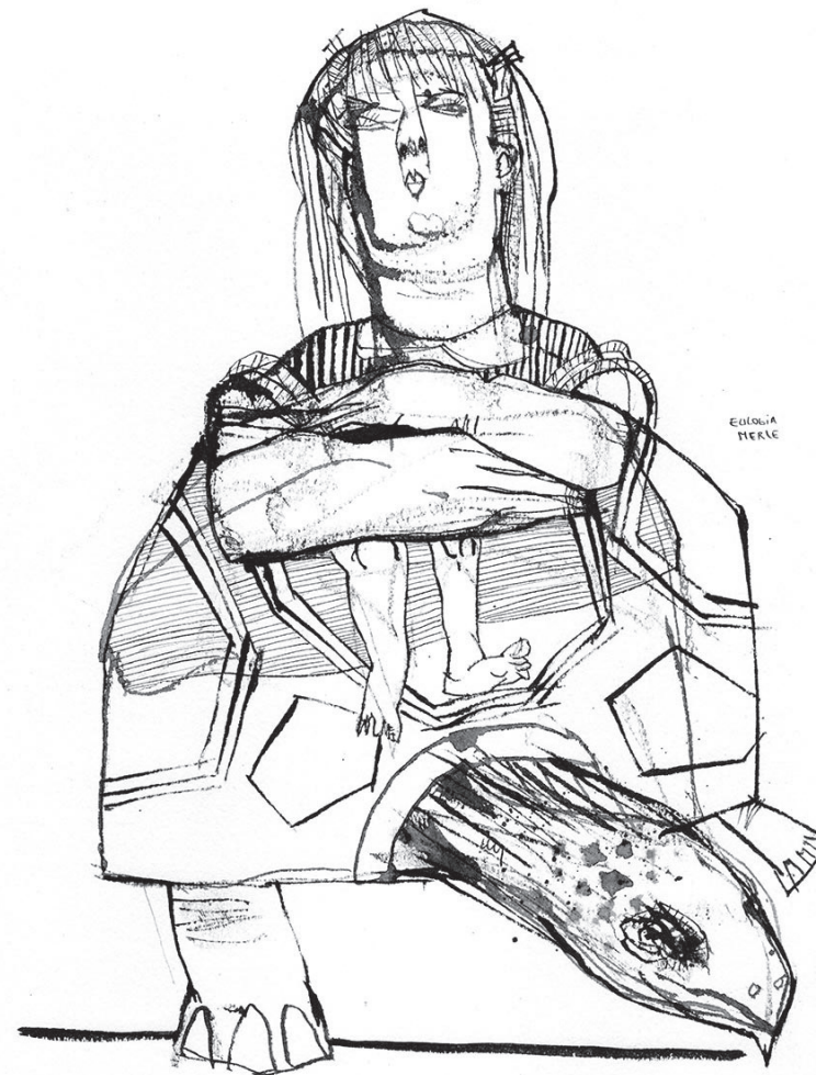
Alicia II 2017 Tinta china sobre papel 30 x 42 cm