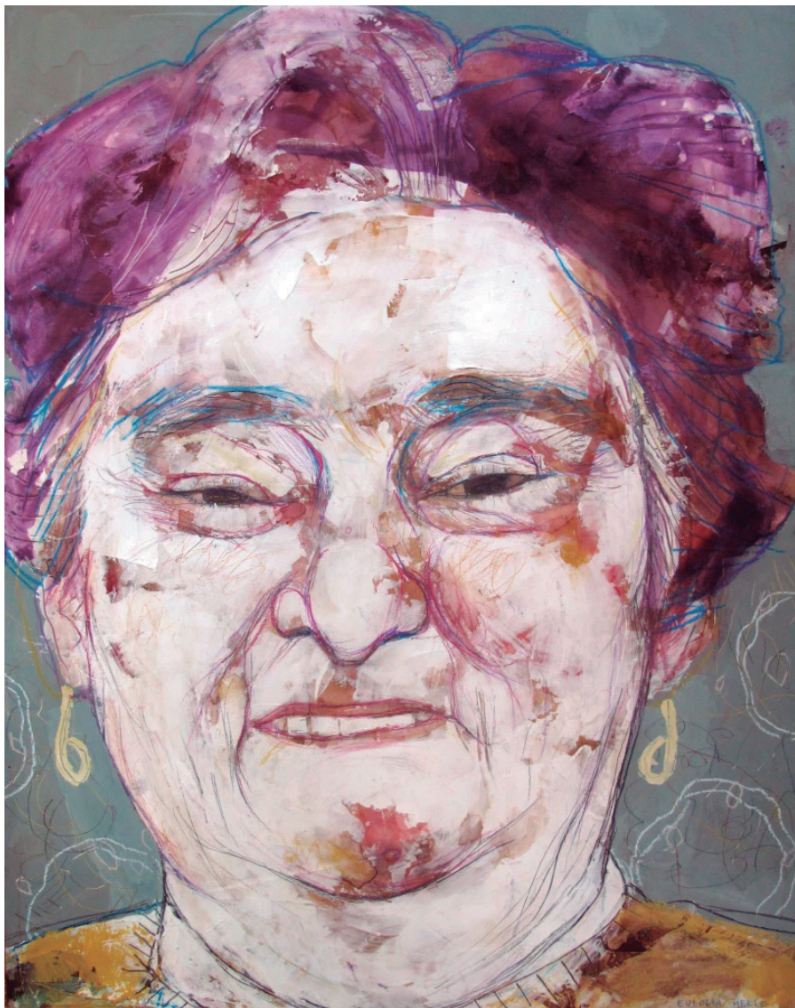
Retrato privado 2019 acrílico y lápiz sobre tabla 45 x 60 cm