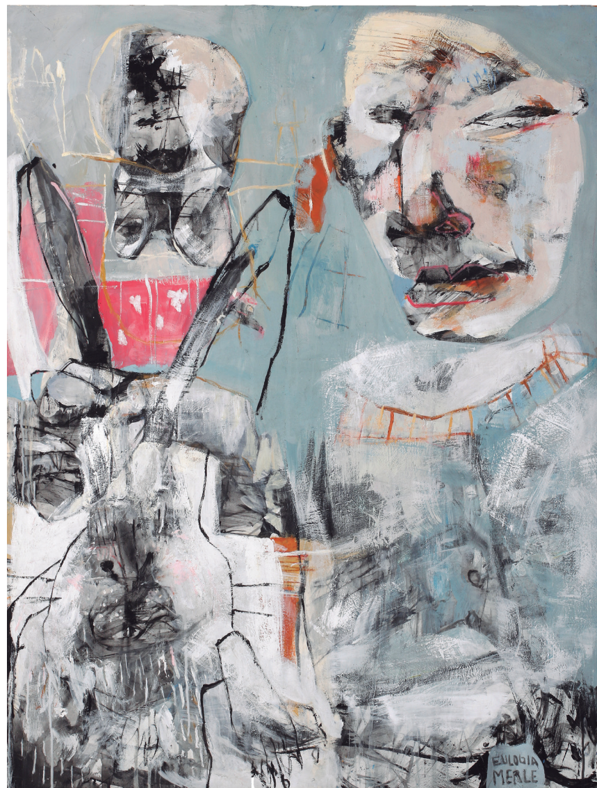
Hombre III 2021 Acrílico sobre tabla 30,5 x 46,5 cm