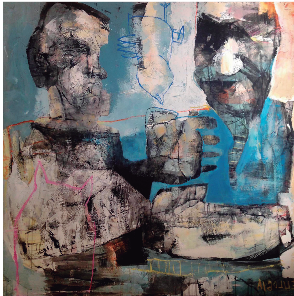
El consejo 2019 Acrílico sobre tabla 122,5 x 122,5 cm