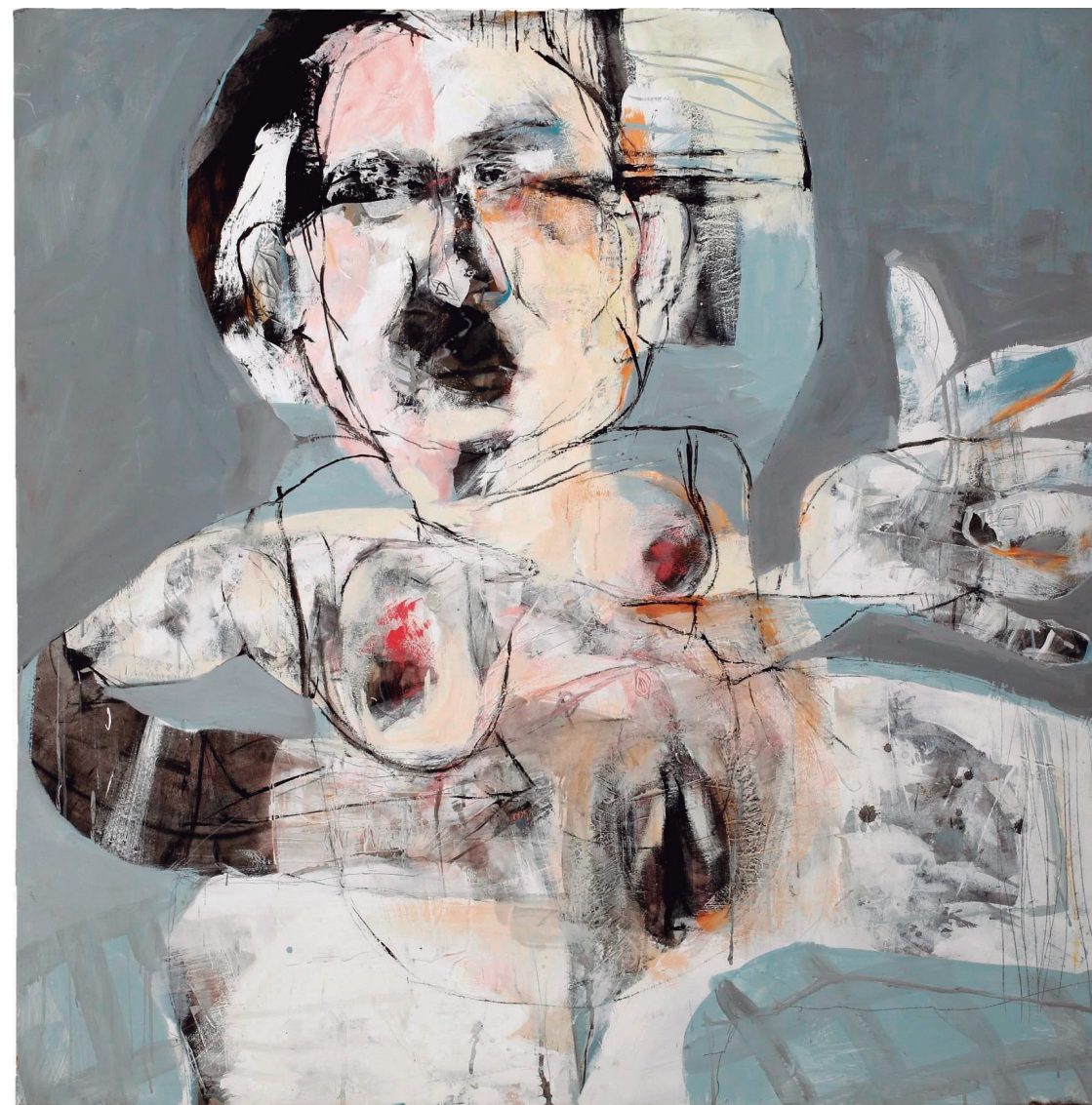
Mujer XVIII 2020 Acrílico sobre tabla 122 x 122 cm