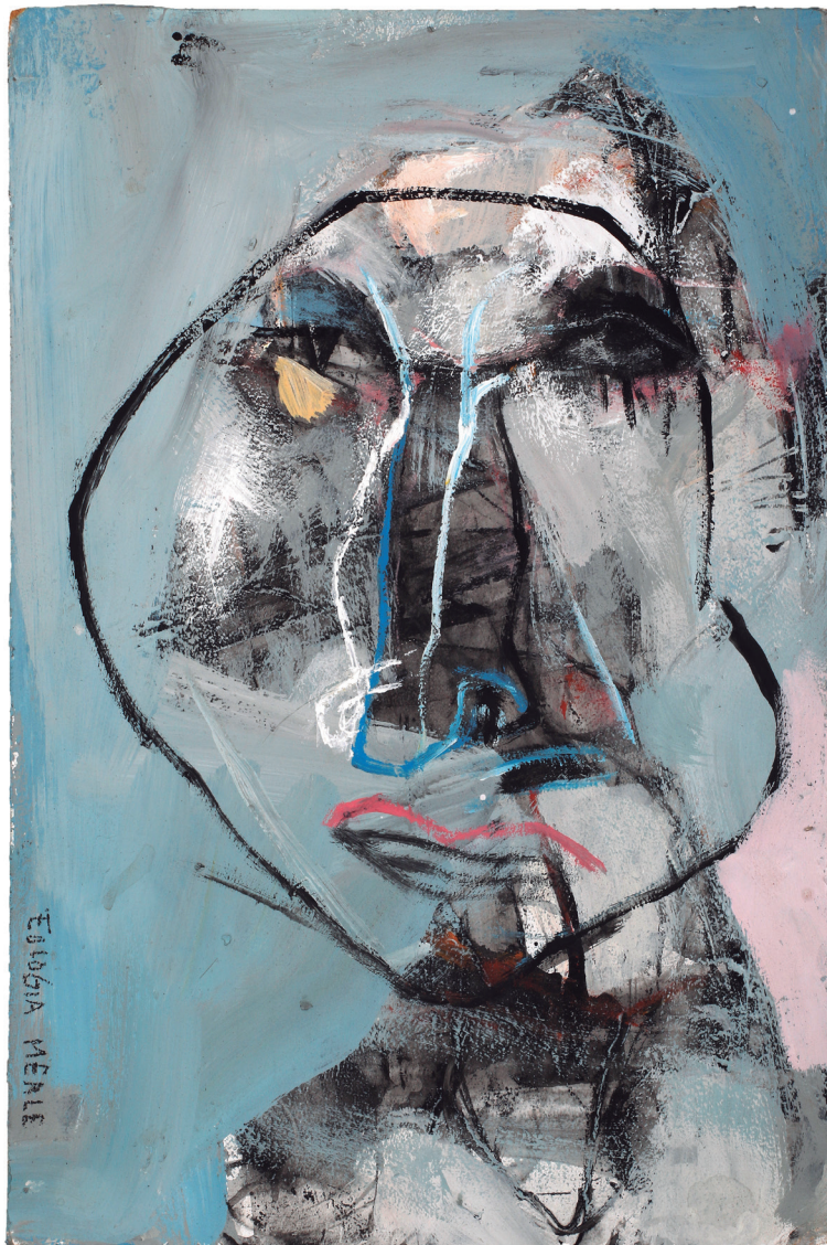
Hombre III 2017 Acrílico sobre tabla 30,5 x 46,5 cm