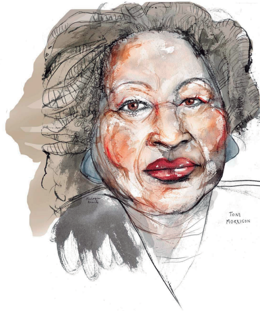
Toni Morrison 2020 Tinta y pastel sobre papel 35 x 50 cm