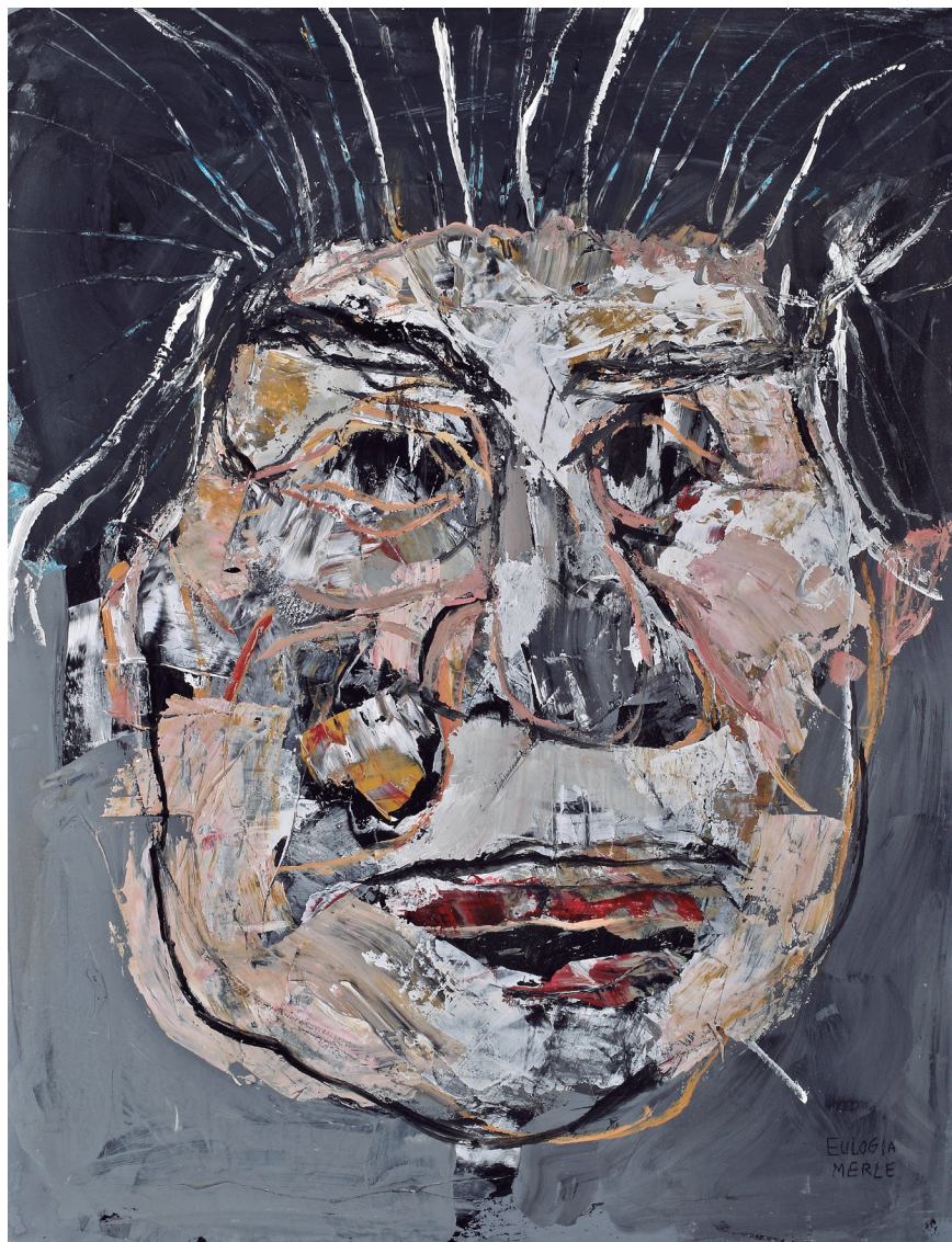
Juja III 2019 Acrílico sobre tabla 46,5 x 61 cm