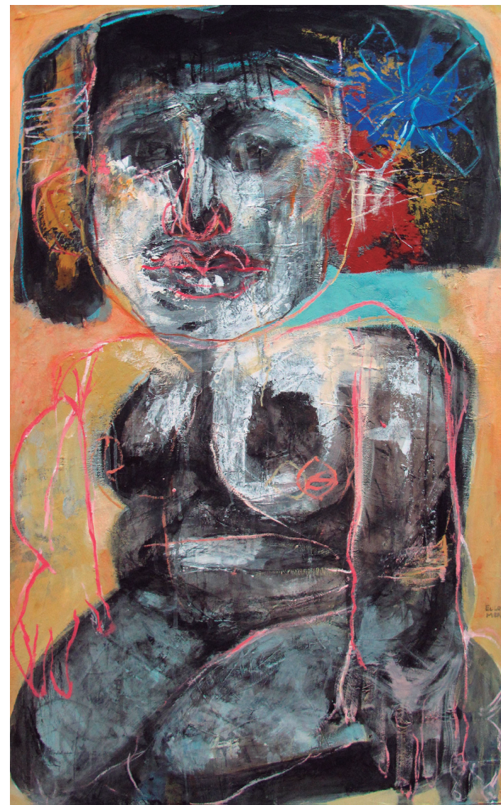
Mujer TONAL 2021 Acrílico sobre tabla 60 x 120 cm