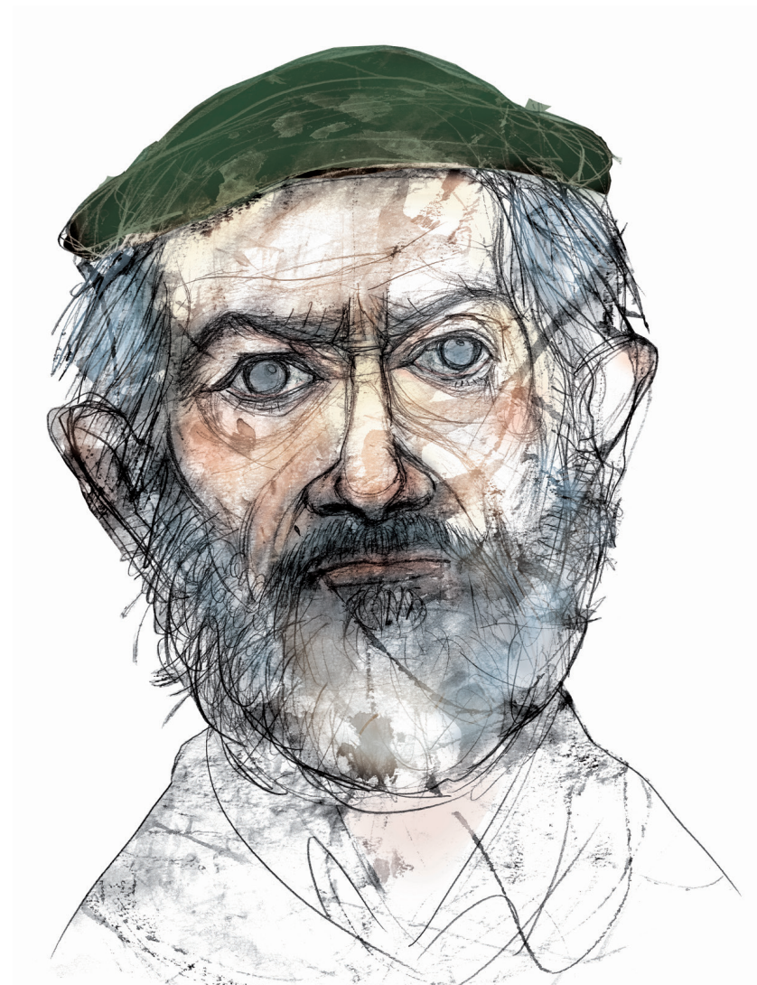
Alexandre Campos Ramírez 2011 Tinta y pastel sobre papel 35 x 50 cm